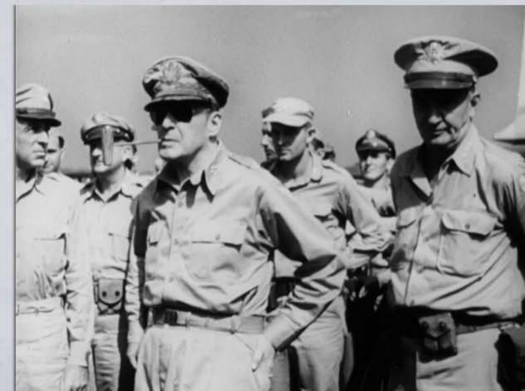
1945 (昭和20) ダグラス・マッカーサー