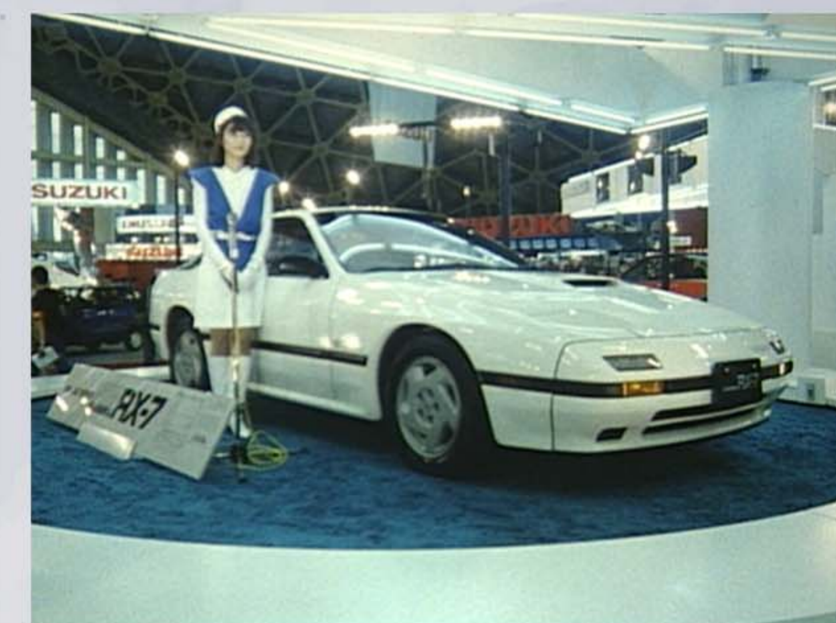
1985 (昭和60) 第26回東京モーターショー