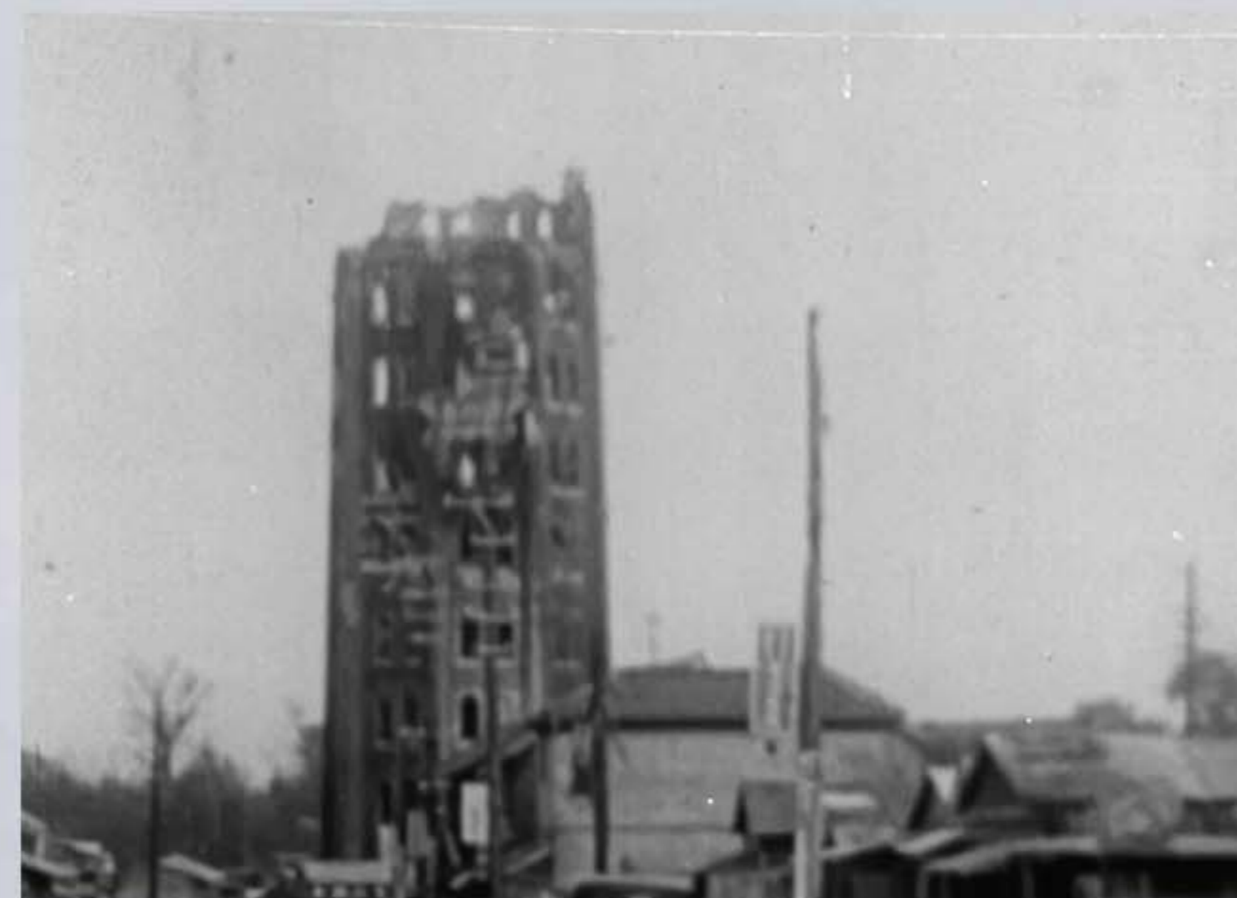
1923 (大正12) 関東大震災