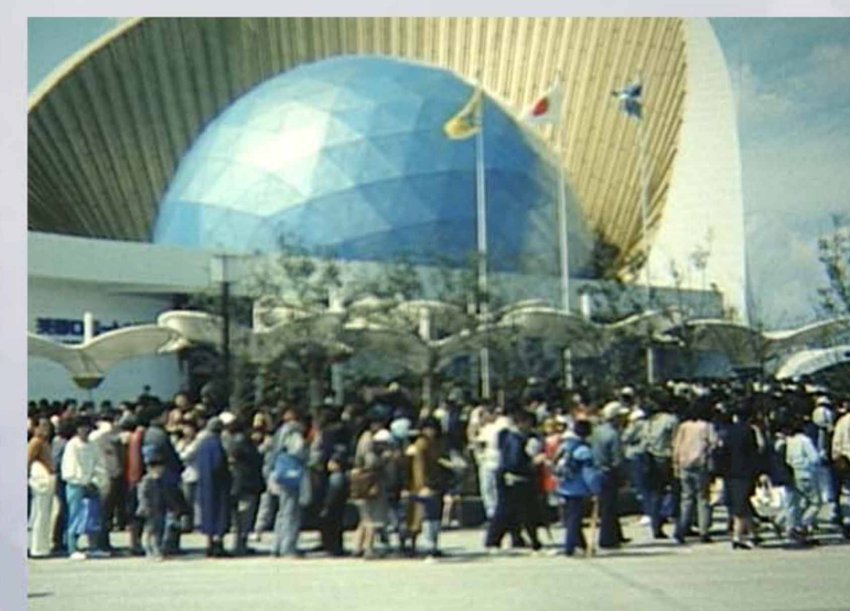
1985 (昭和60) 科学万博つくば '85 開幕